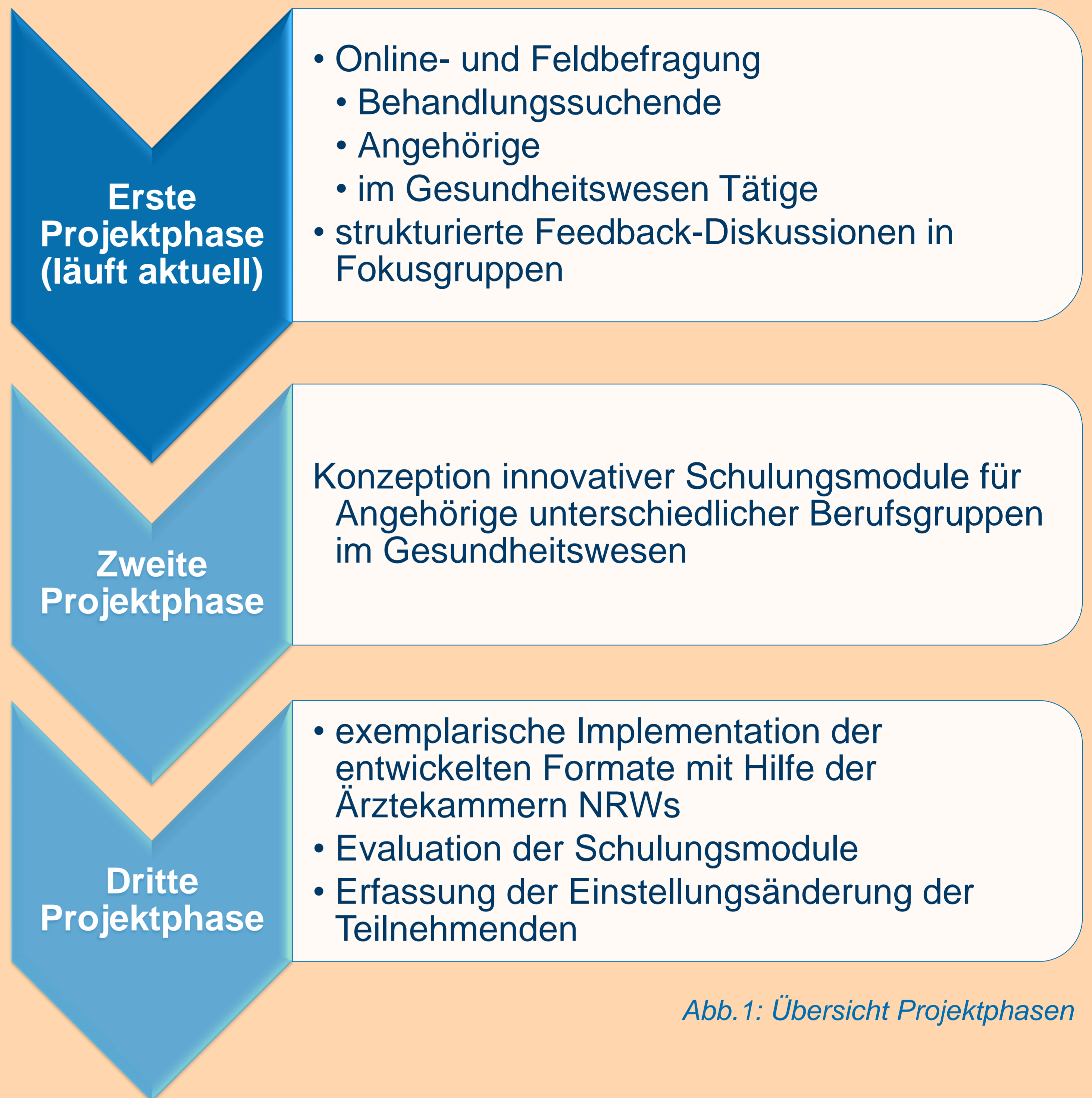
Abb. 1: Übersicht Projektphasen

Das Projekt TRANS*KIDS hat daher zum Ziel, durch die Entwicklung von Schulungsmaßnahmen für Mitarbeiter:innen des Gesundheitswesens, die bedarfs- und bedürfnisgerechte sowie diskriminierungsfreie Gesundheitsversorgung von Kindern und Jugendlichen mit Geschlechtsinkongruenz, Geschlechtsdysphorie sowie ihren Sorgeberechtigten zu verbessern und weiterzuentwickeln.